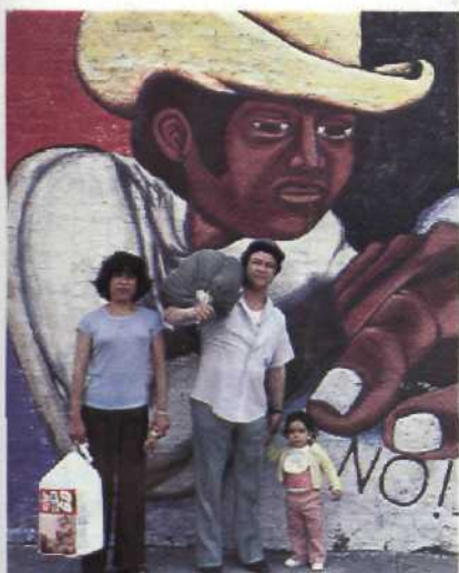
Es gibt viele Chicagos – ein irisches, polnisches, jüdisches, deutsches, hispanisches. Die Einwanderer haben diese Stadt geprägt Seite 56