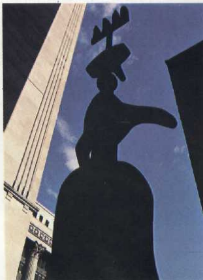
Kunst und Wolkenkratzer: Miró und Picasso in downtown Chicago Seite 36