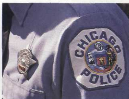
Chicago Police: Die Cops leben gefährlich und machen die Dreckarbeit. Ein deutscher Polizist aus Frankfurt war 14 Tage dabei Seite 70