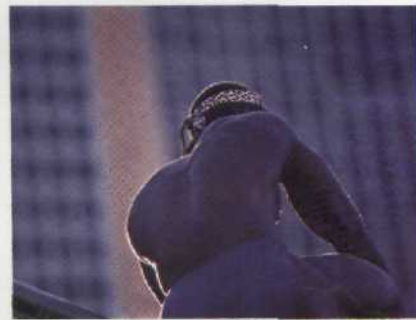
Vierzig Prozent von Chicagos Einwohnern sind schwarz, die meisten leben in Slums, viele haben keinen Job. Ist der Rassenkrieg programmiert? Seite 52