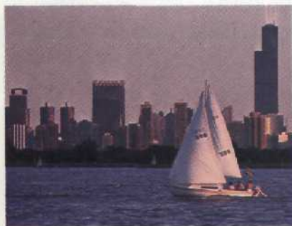
Chicagos Skyline, überragt vom Sears Tower, dem höchsten Gebäude der Erde. Ein weltbekannter Fotograf porträtiert die Stadt Seite 18