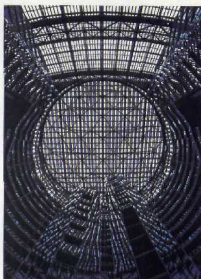
Chicago-Stil: Bauwerke als Symbole der Demokratie Seite 112