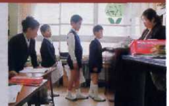
TITELBILD: FUJIT-SAN