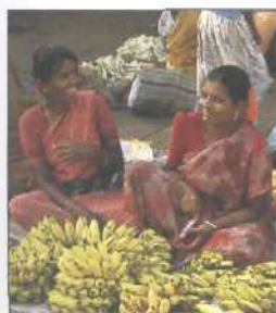
Obstverkäuferinnen an einer Straße in George Town, Chennai