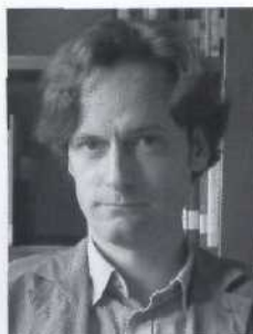
Wagner > Seite 6