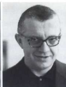
Giese > Seite 8