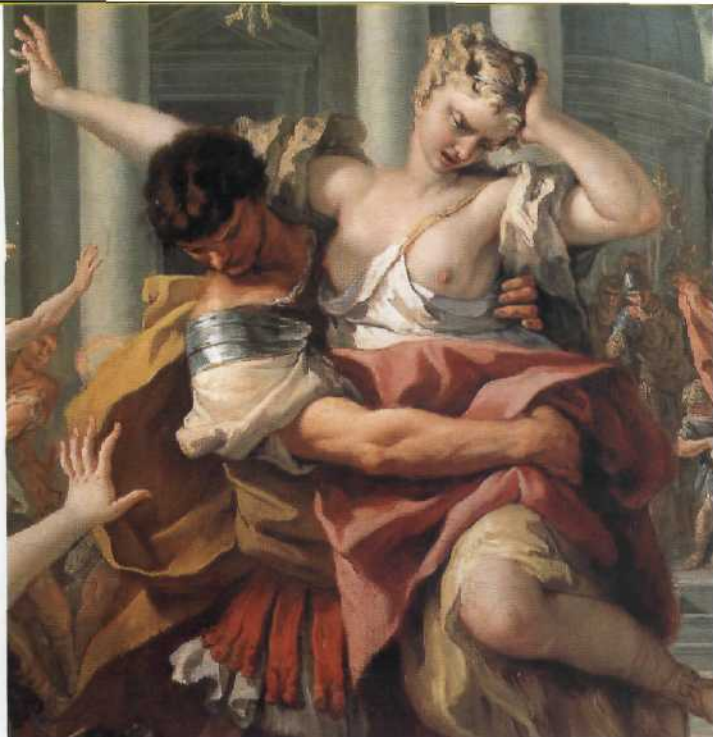
Museum Liechtenstein > Seite 32