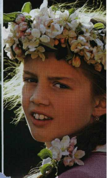
Fremde Federn: Im Frühling tragen 300 000 Obstbäume im Mostviertel ihre Blütenpracht. Sie steht auch jungen Mädchen Seite 146