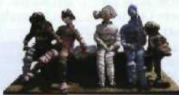
Ju Mings Living World (1987)

SPAZIERGANG DEN EAST COAST PARK ENTLANG 116