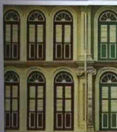
Shophouses an der Sago Street