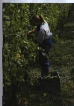
Weinlese im Elsass