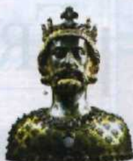
Büste Karls des Großen