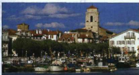
Das Fischerdorf St-Jean-de-Luz in den Pyrenäen