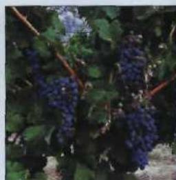
Reife Trauben – die Basis für edle Bordeaux-Weine