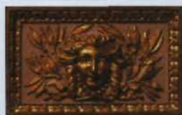
Dekordetail im Grand-Théâtre de Bordeaux