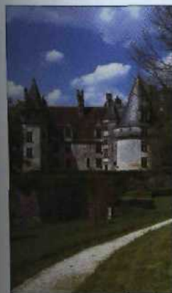
Das Château de Puységur in der Dordogne