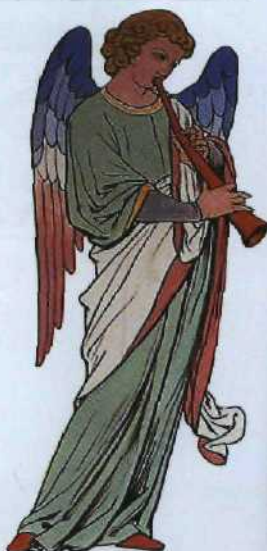
Schmuckbild im Rosa Zimmer, Château de Roquetaillade