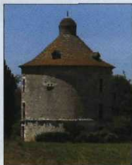
Fast wie ein Burgturm: Taubenschlag in Lot-et-Garonne