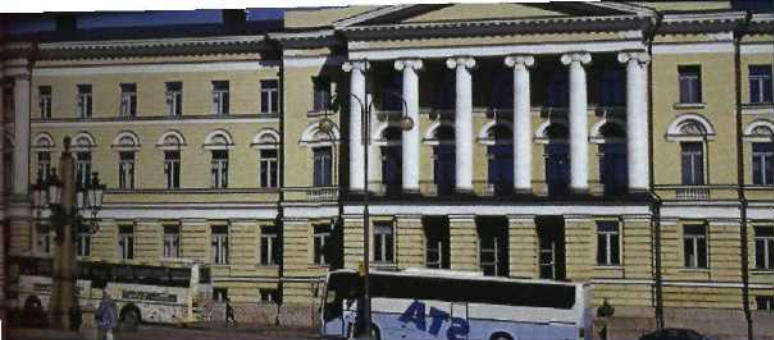
Fassade des Regierungspalais am Senatsplatz (Senaatintori)