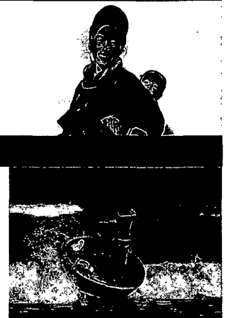
TITELBILD: SEGELTÖRN IN DER HALONG-BUCHT

SPRÖDE SCHÖNHIT: Die Apsaras von Angkor haben nur einen Makel – sie bröckeln