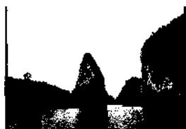
Bucht von Pangna in Südthailand ▶ S. 20