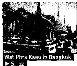
Wat Phra Kaeo in Bangkok ► S. 12