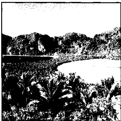
Traumstrände auf Ko Phi Phi Don ▶ S. 228