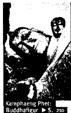
Kamphaeng Phet: Buddhafigur ► S. 210