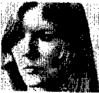
Rita Maiburg Der erste weibliche Linienflugkapitän