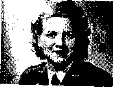
Jacqueline Cochran Die „schnellste Frau der Welt“