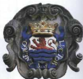
Wappen von Zeeland