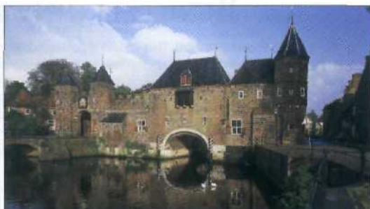
Die Koppelpoort in Amersfoort