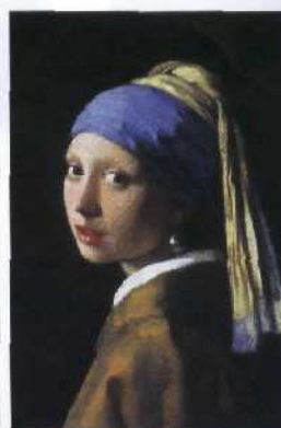
Das Mädchen mit der Perle (1665) von Johannes Vermeer