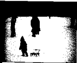
St. Petersburger genießen den Schnee vor der Admiralität