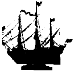
Schiffsmodell aus Bronze, ein Symbol für St. Petersburg