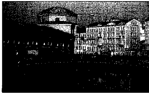
Die Kleine Marstallbrücke führt über die Moika