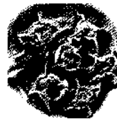
Pelmeni , aus Sibirien stammende Fleisch- oder Fischklöße