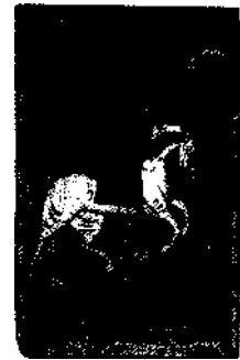
Ikone des hl. Georg mit dem Dra- chen (15. Jh.), Russisches Museum