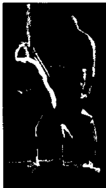
Peterhof: vergoldete Skulptur an der Großen Kaskade