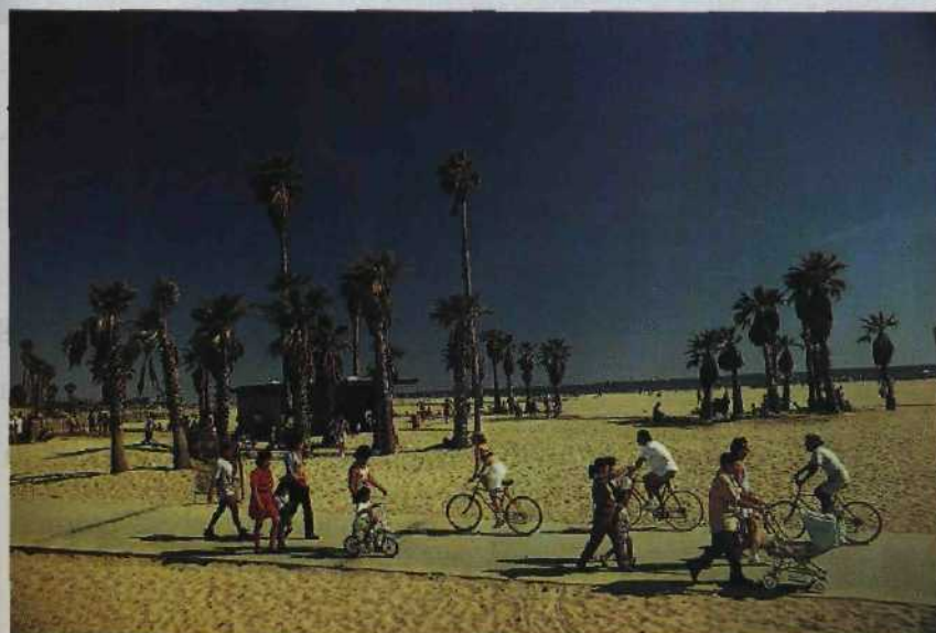
Lifestyle-Meilen am Pazifik: LAs Strände sind endlos