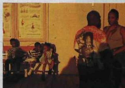
Sunny afternoon auf kalifornisch: Farbige Impressionen einer Multikultur Seite 16