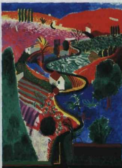
David Hockneys „Nichols Canyon“ Seite 64