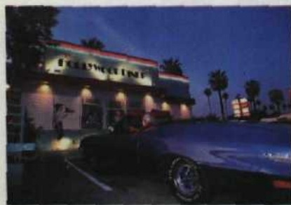
Mythos „Sunset“: An der legendären Glitzerstraße inszeniert sich Luxus Seite 100