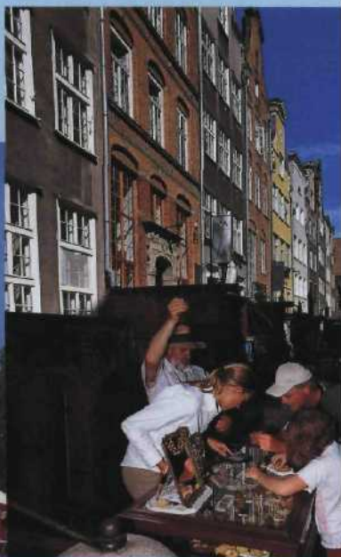
Auf der Suche nach B... in der Fra...