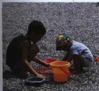
Kies ersetzt den üblichen Sand an fast allen Stränden des Gardasees