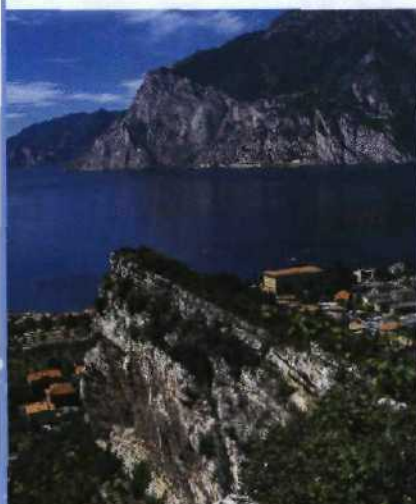
Eines der typischen Bilderbuchpanoramen des Gardasees