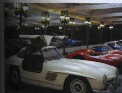
Historische PS im Automobilmuseum Mülhausen