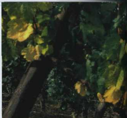
Weinernte in Hunawihr