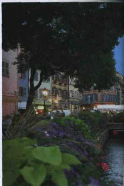
Colmar mit schmuckem Fachwerk und Kanäl