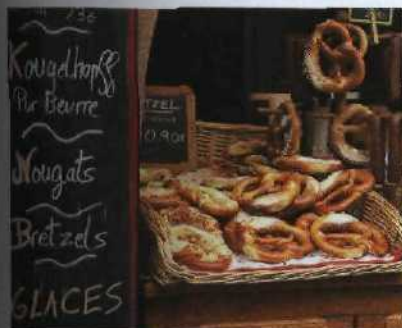
Bretzeln schmecken süß oder salzig.

in das Planquadrat der Übersichtskarte auf S. 8/9, z.B. ► [c 4], oder in einen Stadtplan, z.B. bei Straßburg ► S. 174 [c 3] sowie zusätzlich (mit Großbuchstabe) in das entsprechende Plan- quadrat der herausnehmbaren Faltkarte ► [C 3]