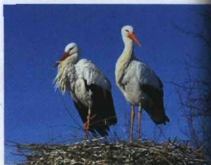
Störche auf dem Dach sind Boten des Glücks.