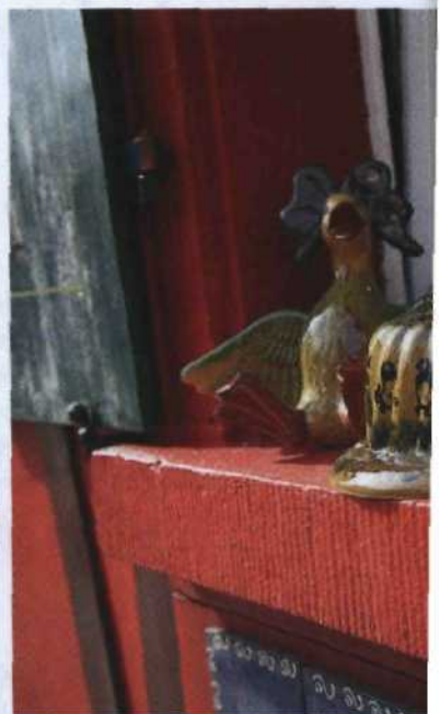
Keramik in Betschdorf