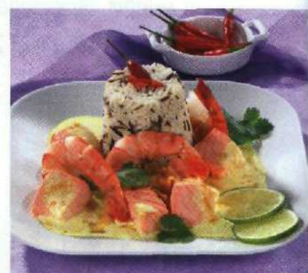
Gourmet-Küche für Eilige