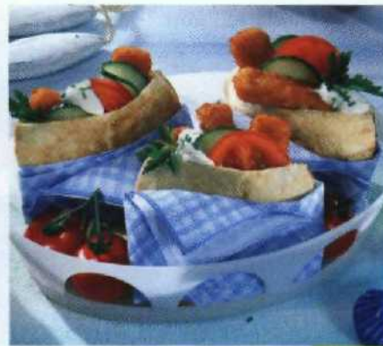
Das finden Kids cool S.138