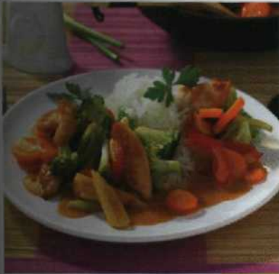
Feines von Hähnchen & Pute S.98