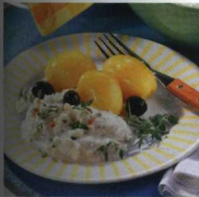
Fleischlos glücklich S.128