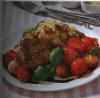
Blitzkur für die Figur S.158