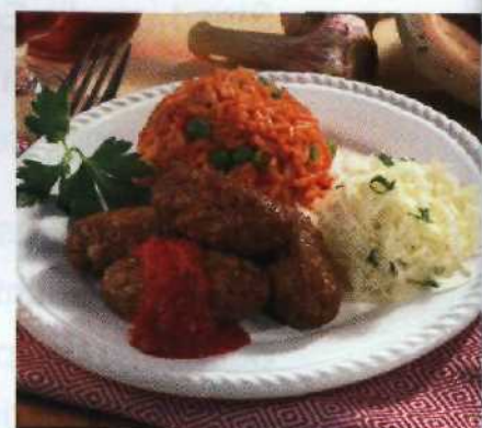
Hack ist Trumpf!