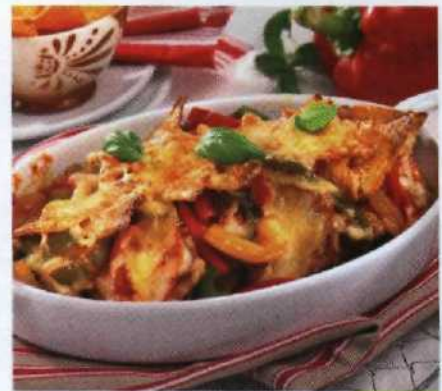
Aber bitte mit Käse! S.148