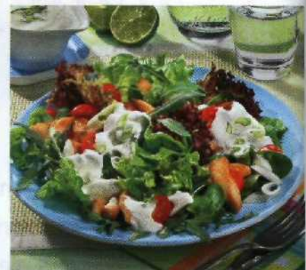
Diese Salate machen an