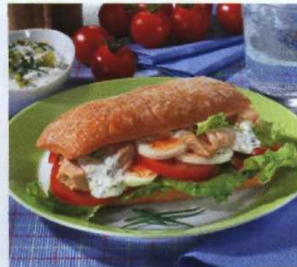
Schnell-Imbiss mit Brot S.168