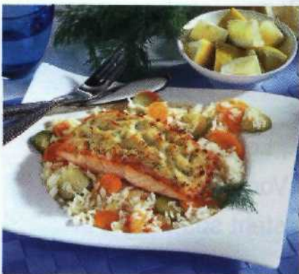
Fisch à la minute