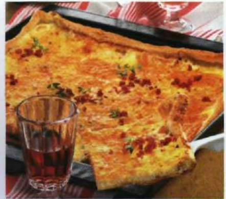
Heiße Hits für die Party S.116