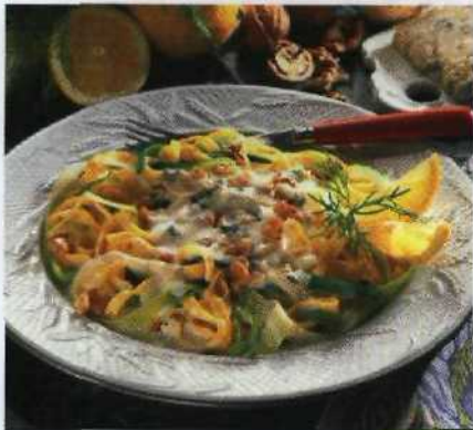
Nudeln – stets ein Renner