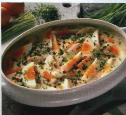
Allerlei mit Ei