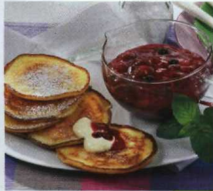
Hauptsache süß! S.108