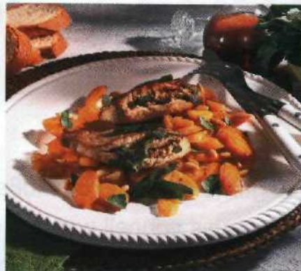
Kurz gebraten – gut beraten