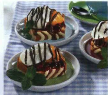
Süßes Finale mit Pfiff S.178