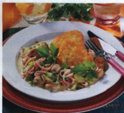
Das zaubern Sie mit links!