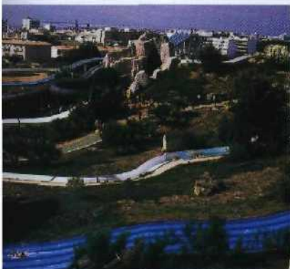
Grenzenloser Wasserspaß im Aqualand in Es Arenal