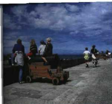
Lebendiger Geschichtsunterricht an der Küste der Bretagne

Tour 6 – Apothekergrotte an wilder Küste: die „Tour de Belle-Ile“ .....57