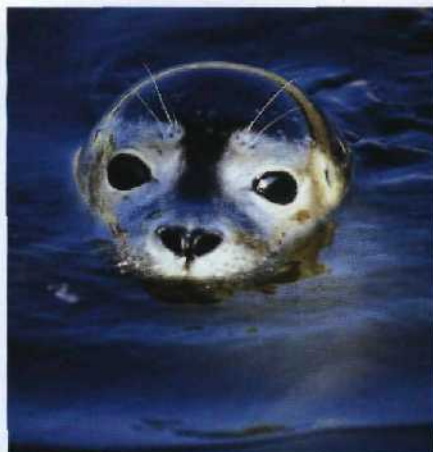
Das größte Säugetier der Küste und von allen Kindern geliebt: der Seehund