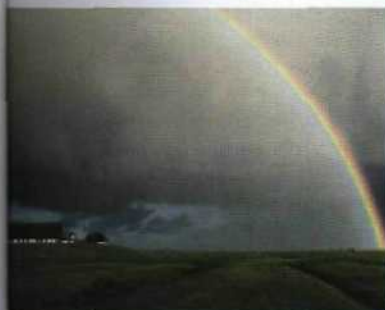
Naturschauspiel über der weiten flachen Marschlandschaft