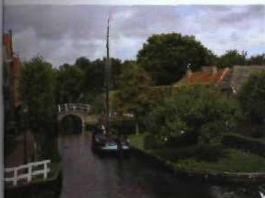
Auf einer Zeitreise im Zuiderzeemuseum siehe Tour 5 S. 53