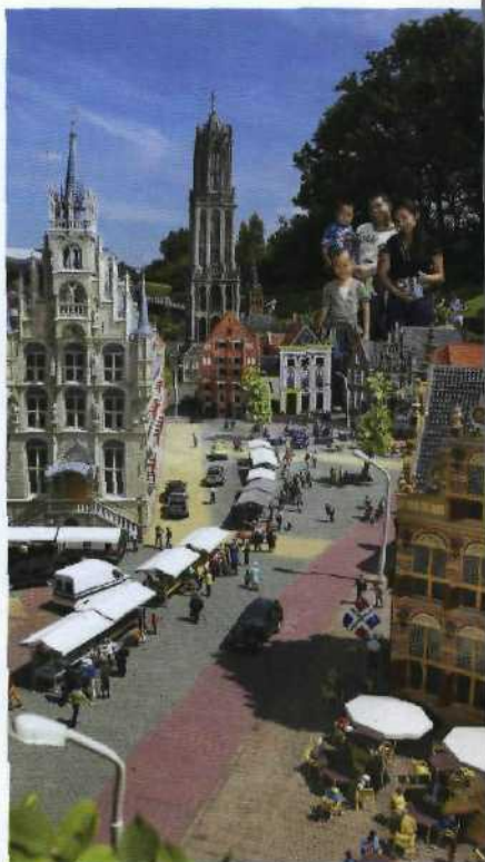
Ganz Holland an einem Tag? Das geht in Madurodam (siehe S. 91)