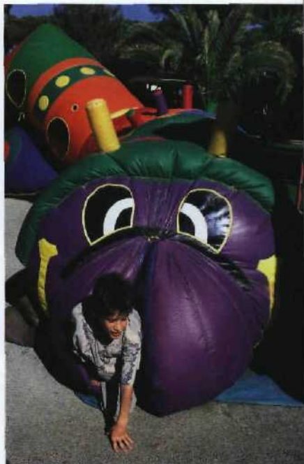
Bunter Kinderspaß im Cavallino Matto (siehe S. 94)