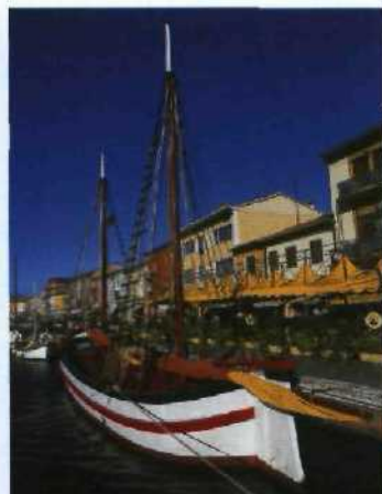
Bunte Boote sorgen im Hafen von Cesenatico für Urlaubsstimmung