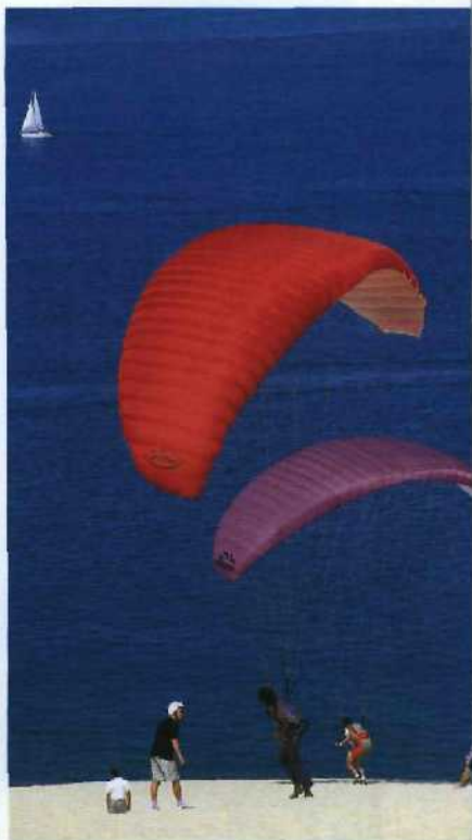
Spektakulär: Paragliding an der Dune du Pilat – der höchsten Düne Europas