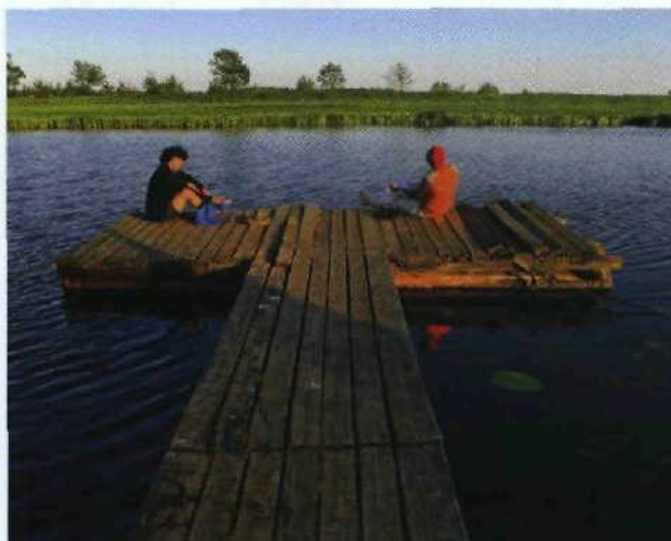
Steg an der Treene in Freesendelf