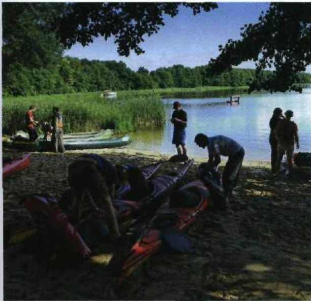
Paddler beladen an der Kanustation Mirow ihre Boote.