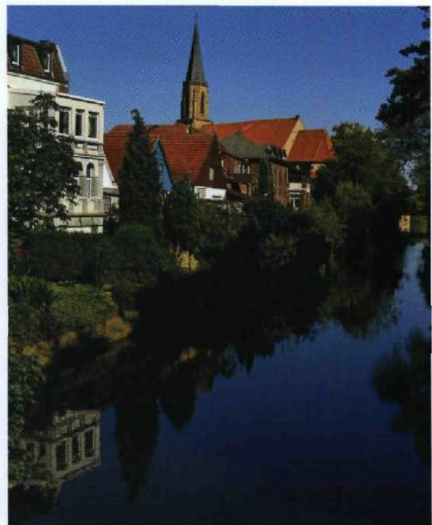
Die Ems führt mitten durch das idyllische Telgte.

21 Rheinsberg Rhin: Von Rheinsberg nach Zippelsförde 66 Lebhaftes Kleinflussabenteuer in Brandenburg