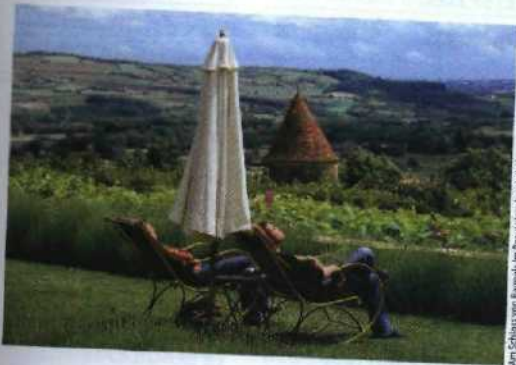
Am Schloss von Baynac im Beaujolais français