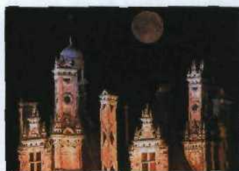
FL. LA. G. G. MOCHTELIN