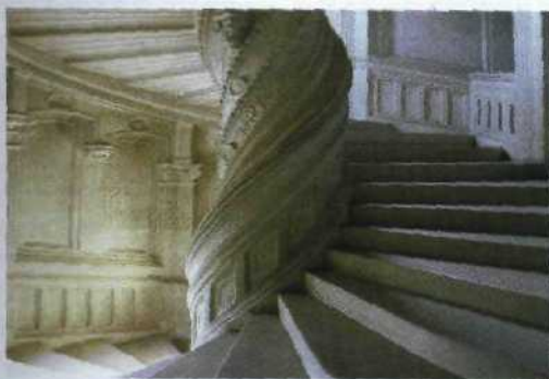
Freigabe: Spieg im Chateau de St-Augustin, Norme, Markt, HATTOCH/NO/03