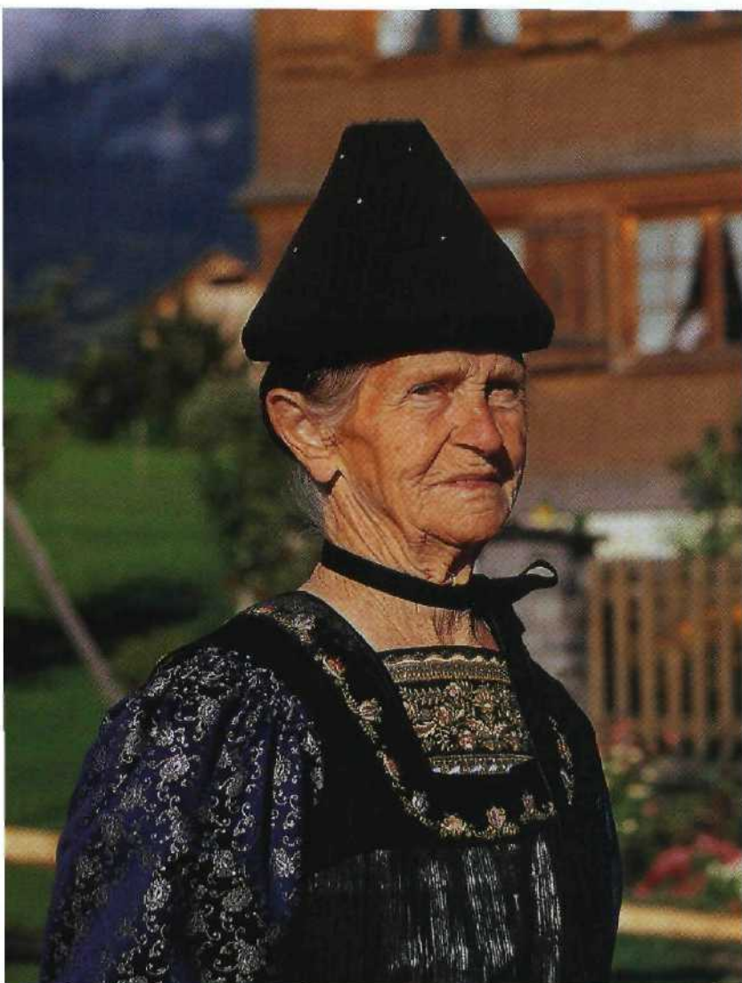
Zu Feiertagen werden traditionell die wunderschönen Trachten getragen (Bregenzerwald)