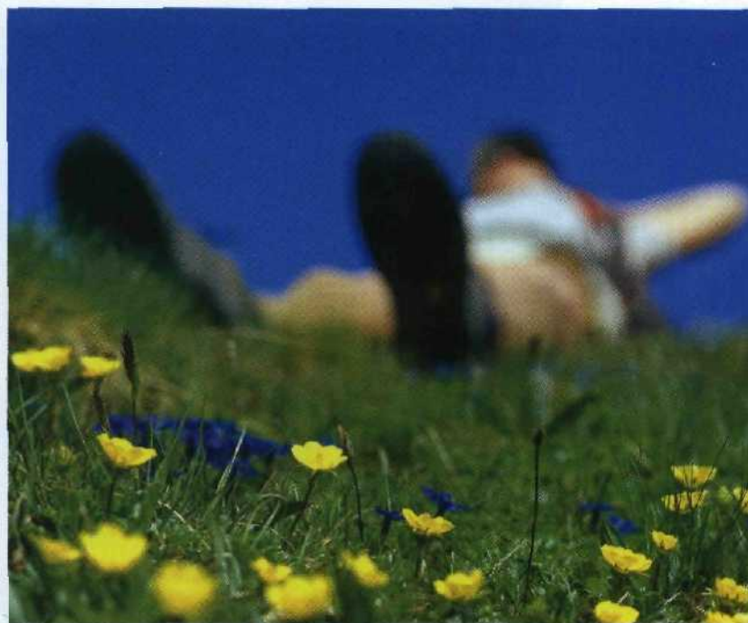
Einfach die Seele baumeln lassen – in der wohlverdienten Pause