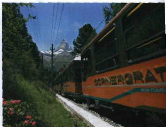
Mit der Gornergratbahn in Richtung Matterhorn