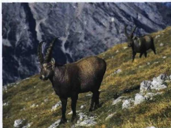
Im Nationalpark Berchtesgaden lassen sich mit etwas Glück Steinböcke beobachten