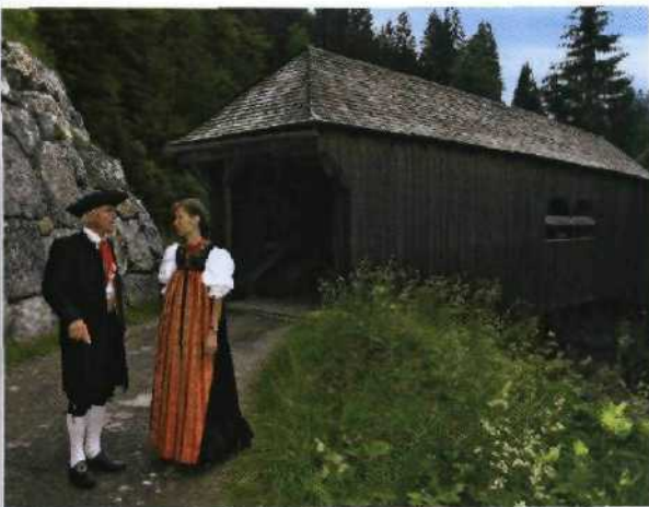
Die Leidtobelbrücke bei Riezlem war bis 1930 Teil der alten Hauptstraße ins Kleinwalsertal