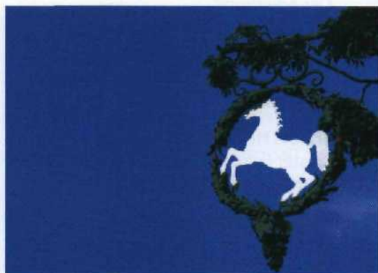
Berühmtes Gasthofsschild »Zum Weißen Rössl«