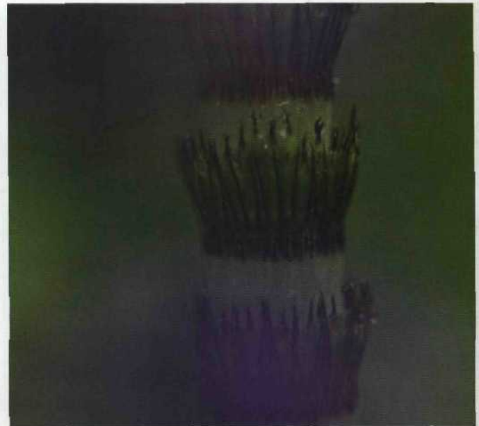
Junger Riesenschachtelhalm hinter einem Günsele