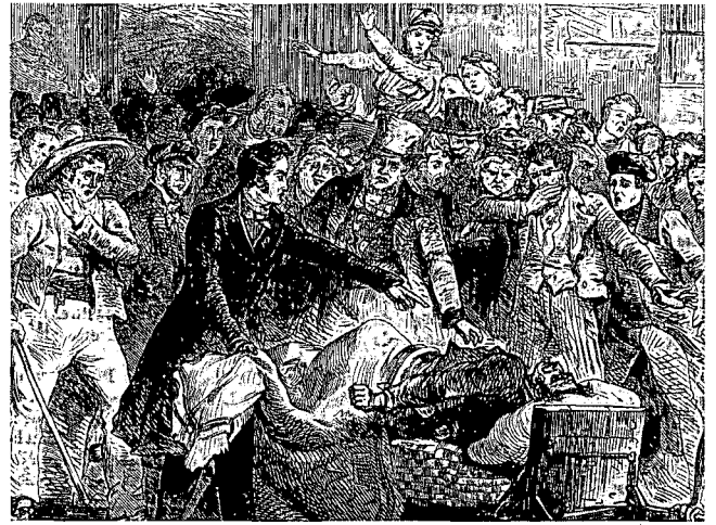
Darstellung der Choleraepidemie 1832 in Paris.