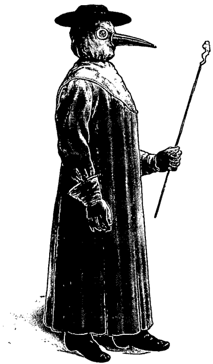
Ein Arzt aus dem 17. Jh. in traditioneller Schutzkleidung gegen die Pest.