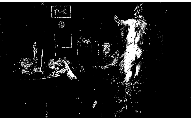
„Syphilis“ von Richard Cooper (1910).