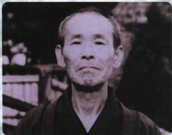
Jiro Murai – er entdeckte Jin Shin Jyutsu