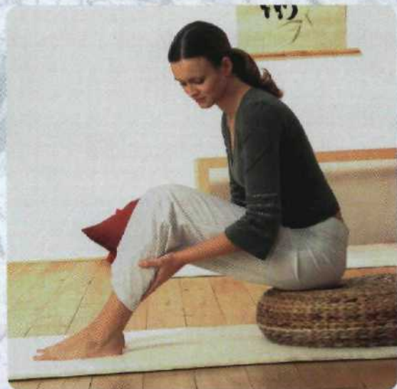
Wohltuende Berührung der Hände – das tägliche Strömen