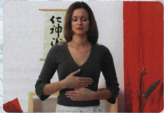
Beim Strömen sind wir ganz im Hier und Jetzt