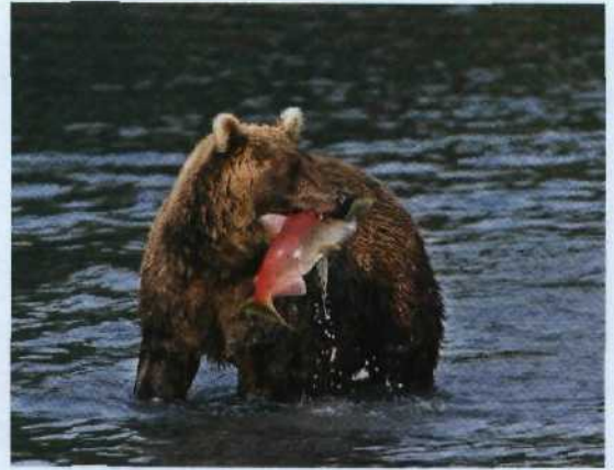
▶ 82 Feinschmecker: Braunbär mit Rotlachs auf Kamtschatka, Russland