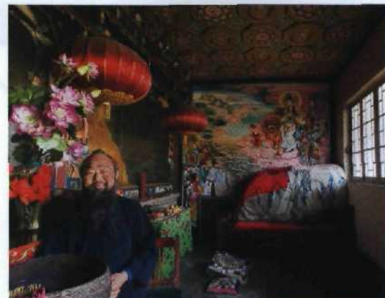
▶ 172 Ganz oben: taoistischer Mönch auf dem Hua Shan, Zentralchina