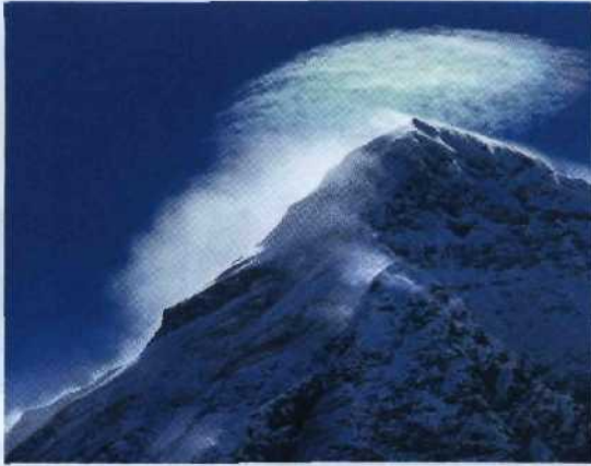
◀ 12 8848 Meter – höher geht es nicht: der Mount Everest im Himalaja