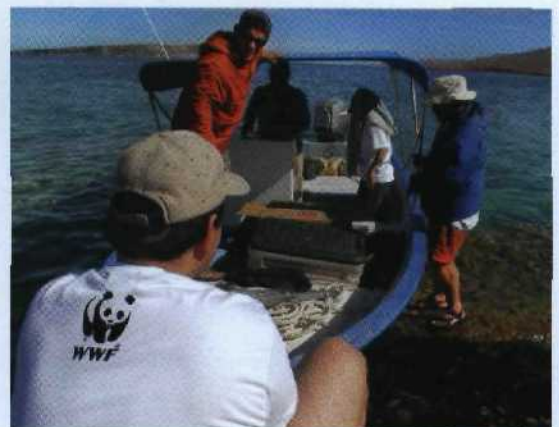
▶ 218 Alle in einem Boot: WWF-Aktivistin in Baja California, Mexiko