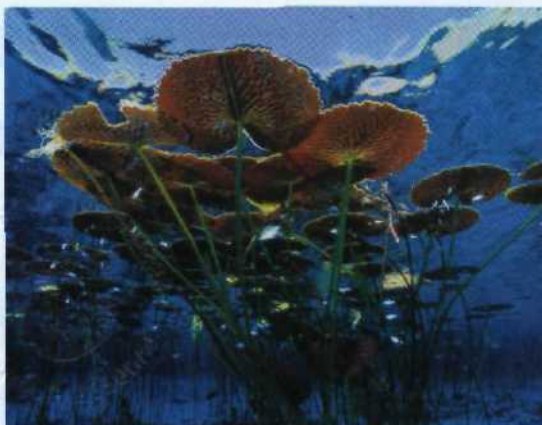
▲ 106 Mangrovensetzlinge in der Lagune von Funafuti, Tuvalu, Südpazifik

Kamtschatka. Verzauberte Wildnis ..... 82