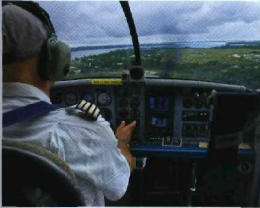
◀ 60 Ganz fern: Anflug auf den Omboué-Airstrip in Gabun, Zentralafrika