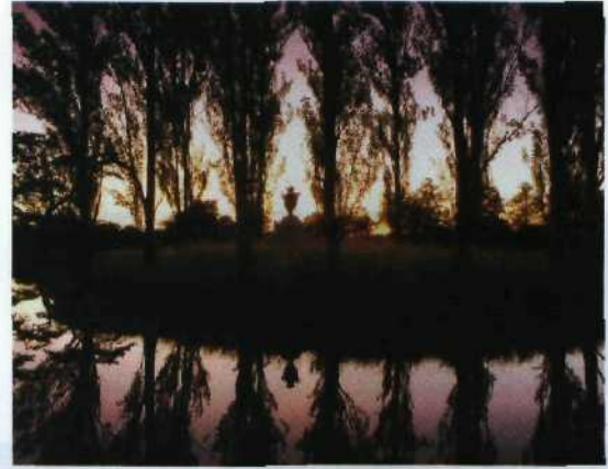
▶ 28 Ganz nah: die Rousseau-Insel bei Wörlitz an der Mittelelbe