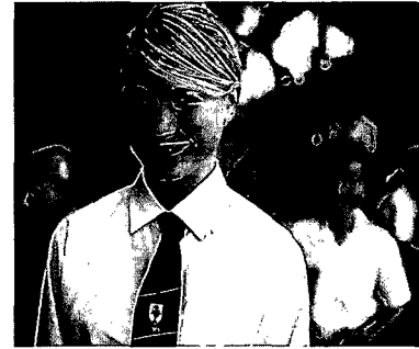
»DAS LAND DA OBEN IM NORDEN«: Fünf Deutsch-Namibier sprechen über ihre Wurzeln