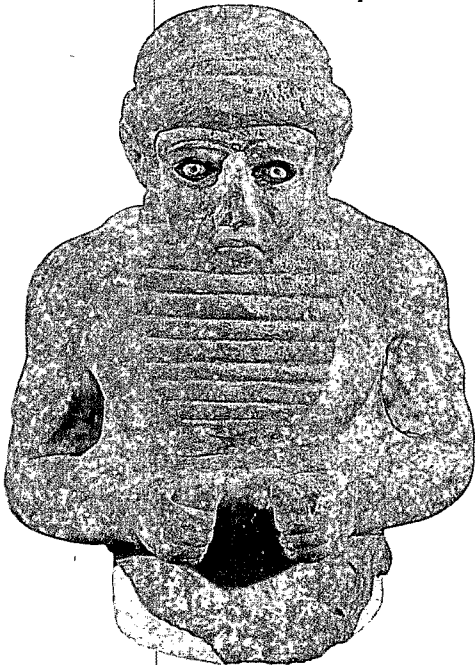
Figur eines Mannes aus Uruk, Alabaster, um 3100 v. Chr.