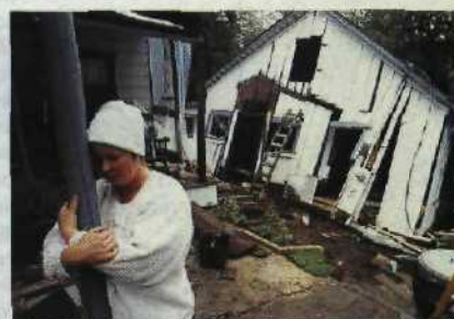
Noch einmal Glück gehabt beim Beben im Oktober 1989. Aber jeder weiß, daß die Erde keine Ruhe gibt Seite 90