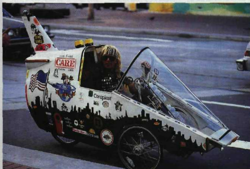
Freie Fahrt für Außenseiter und gegen die fade Gleichmacherei