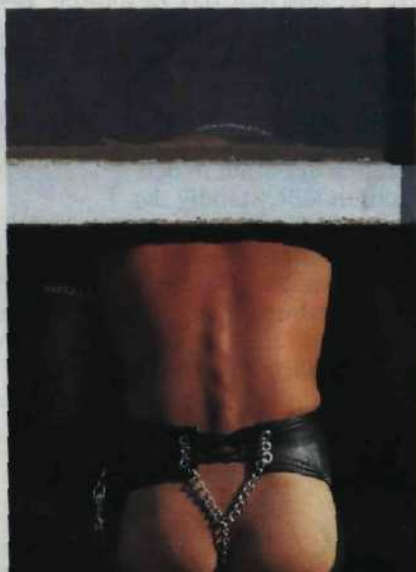
Traumstadt der Schwulen Seite 52