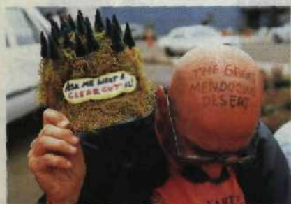
Umweltschützer greifen zu drastischen Mitteln, um die Redwood-Bäume vor der Kreissäge zu bewahren Seite 84