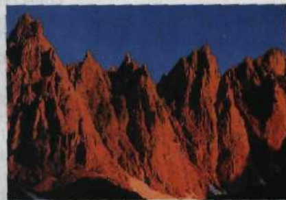
Wer auf dem Highway 395 fährt, hat die Berge der Sierra-Nevada im Blick und die heißen Quellen zu Füßen Seite 60