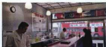
Restaurant: Fryer's Delight 19 Theobald's Road, London – Holborn Tel: 0044 (0)20 74054114 Seite 34