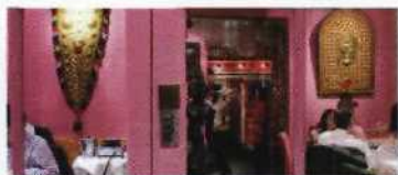
Restaurant: Rasa Samudra 5 Charlotte Street, London – Soho Tel: 0044 (0)20 76370222 Seite 40