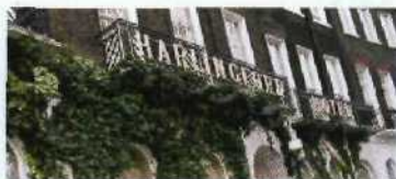
Hotel: Harlingford Hotel 61–63 Cartwright Gardens, London – Bloomsbury Tel: 0044 (0)20 73871551 Seite 16