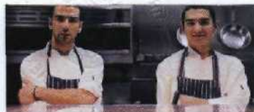
Restaurant: Canteen 2 Crispin Place, London – Shoreditch Tel: 0044 (0)845 6861122 Seite 52