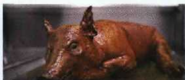
Restaurant: St. John 26 St. John Street, London – Clerkenwell Tel: 0044 (0)20 72510848 Seite 22