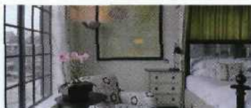
Hotel: The Soho Hotel 4 Richmond Mews, London – Soho Tel: 0044 (0)20 75593000 Seite 8