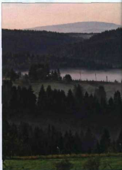
Morgennebel auf dem Berg Kamena Gora, bei Pr