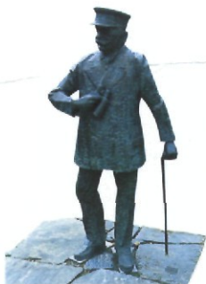
Der Luftschifferfinder Graf Zeppelin