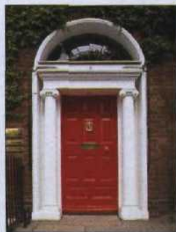
Georgianische Tür am Fitzwilliam Square, Dublin (siehe S. 68)