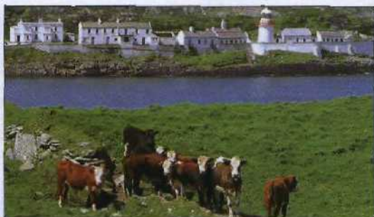
Leuchtturm am Spanish Point bei Mizen Head (siehe S. 167)