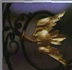
Verzierung am Chorus Gate auf Powerscourt (siehe S. 134f)