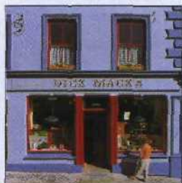
Fassade eines Pubs in Dingle (siehe S. 157)

STRASSENKARTE Hintere Umschlaginnenseiten