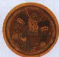
Evangelisches Symbol aus dem Book of Kells (siehe S. 64)