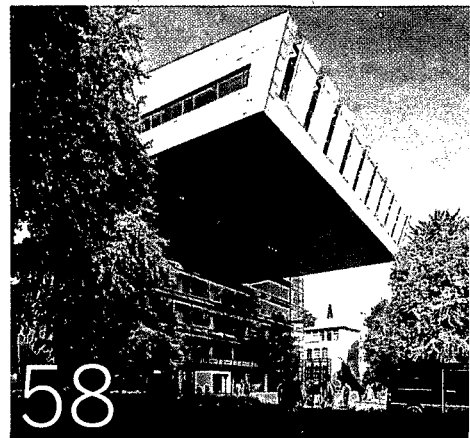
AUSLADEND Das »Super C« ist das beton- und glasgeworbene Zentrum der Exzellenz-Universität RWTH