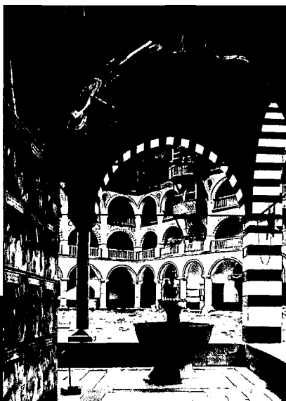
Die Plovdiver Häuser der Wiedergeburtzeit (li.) vermögen ebenso zu faszinieren wie das freskengeschmückte Rilakloster.