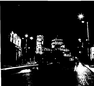
Die Alexander-Nevski-Kathedrale zu Sofia