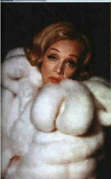
Marlene Dietrich – die berühmteste Berlinerin?