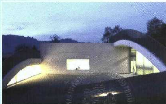
Dreifachkindergarten Ebenholz, Vaduz Planung: Arch.büro Christen; Arch.büro Jan Ritter