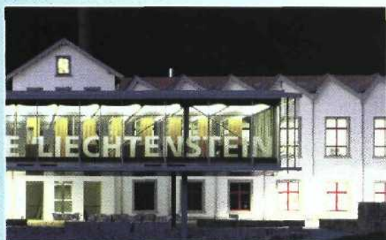
Fachhochschule Liechtenstein, Vaduz Bauherr: Hochbauamt, in Vertretung der Regierung des Fürstentums Liechtenstein, und Gemeinde Vaduz