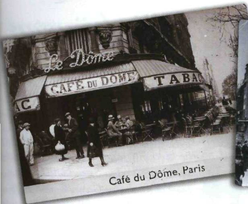
Café du Dôme, Paris