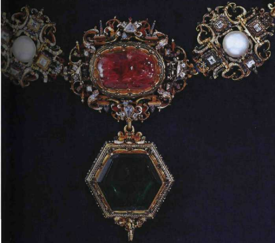
Prunkkette Gold geschmelzt, mit Smaragden, Spinellen, Diamanten und Perlen. Gefertigt gegen 1575 in München. Länge 111 cm. Etwa natürliche Größe. Schatzkammer der Residenz, München.