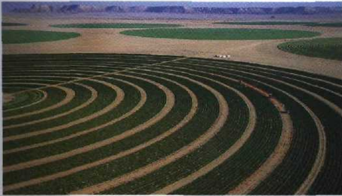
124 Wüste Verschwendung: Luzernefelder in Saudi-Arabien, bewässert mit fossilem Wasser aus uralten Speichern