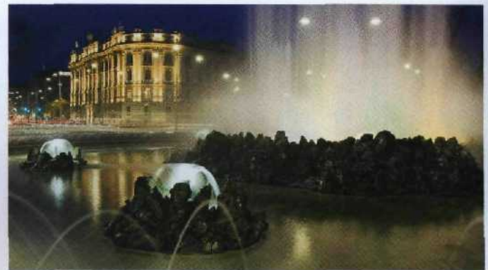
106 Spritzende Pracht: Der Wiener Hochstrahlbrunnen, 1873 vom Kaiser in Betrieb genommen