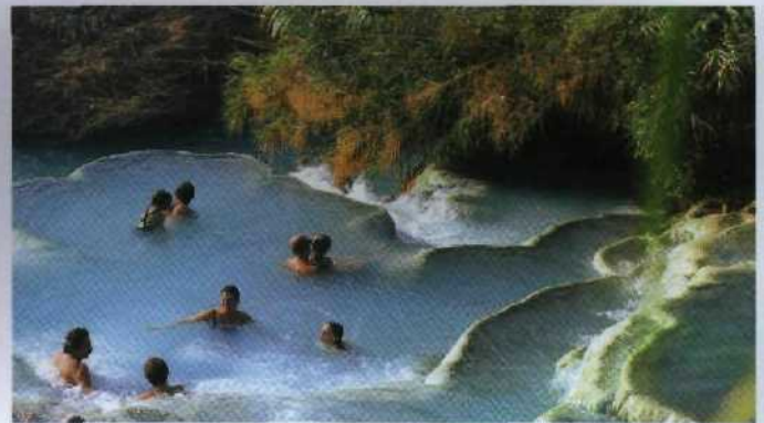
86 Sprudelnder Spaß: Vulkanisch erwärmte Kaskaden bei Saturnia, Toskana