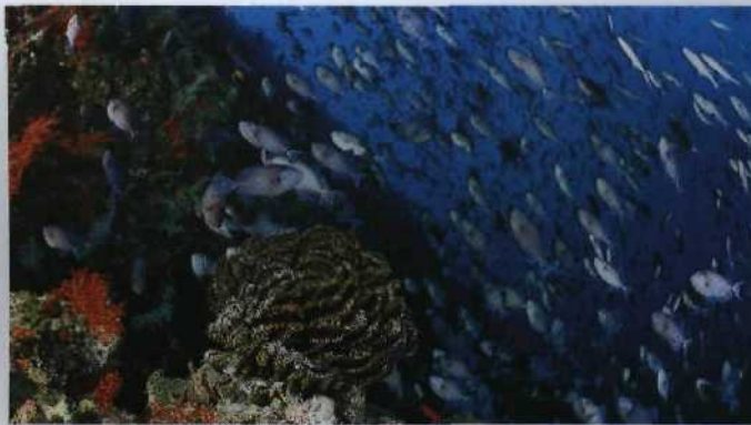
10 Ballett am Riff: Blaue Drückerfische über maledivischen Korallen