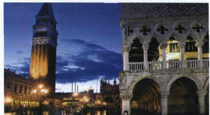
198 Versteinerter Stolz: Venedigs Markusplatz kündigt von einstiger Machtfülle