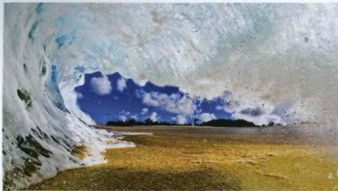
26 Langer Anlauf mit Überschlag: Surf an der Nordküste von Oahu, Hawaii