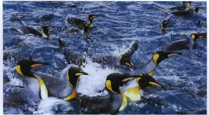
166 Alle im Meer: Königspinguine im kalten Nass vor South Georgia, Antarktis