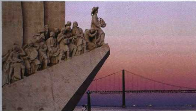
146 Aufbruch in die Welt: Denkmal der Entdeckungen am Ufer des Tejo in Lissabon