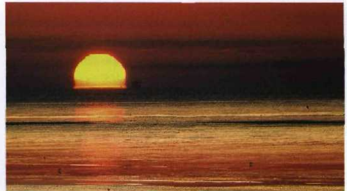
178 Lichtzauber im Watt: Blick von Westermarsch Richtung Borkum