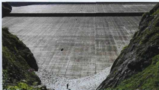
66 Schweizer Pyramide: Die Staumauer Grande Dixence ist die höchste in Europa

Wasser von Kaisers Gnaden Vierhunderttausend Kubikmeter täglich ..... 106