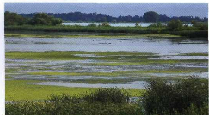
218 Im Auenland: Der WWF kümmert sich um die Donau-Feuchtgebiete im Porțile-de-Fier-Naturpark, Rumänien