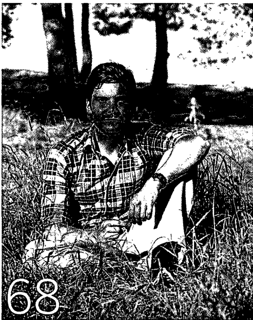
68 LIEBLINGSSTADT Daniel César Martín Brühl Gonzáles Domingo auf dem Tibidabo, mit Blick auf Barcelona