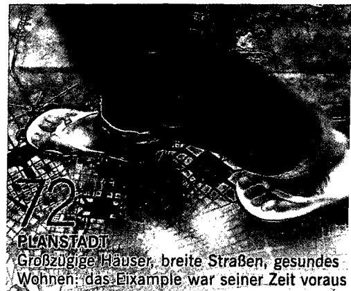
PLANSTADT Großzügige Häuser, breite Straßen, gesundes Wohnen: das Eixample war seiner Zeit voraus